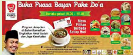
Promo Soto Kauman Express