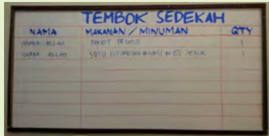
Strategi pemasaran (Tembok sedekah)