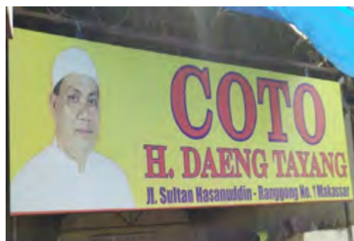
Merek Dagang Usaha Kuliner Soto