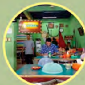
Usaha Kuliner Soto dengan Bangunan Milik Sendiri

Modal usaha kurang lebih sebesar Rp 25-50 juta. Golongan ini belum terlalu mendapatkan akses yang banyak terkait modal dari bank maupun koperasi. Banyak pengusaha masih menganggap hal tersebut menyulitkan terutama secara administrasi.