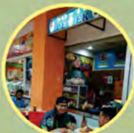
Kuliner Soto di Food Court

Dilakukan di suatu shelter yang dibangun pemerintah, di gerobak ataupun tenda, atau di kaki lima. Modal usaha mereka rata-rata dibawah Rp 15 juta. Golongan ini belum terlalu mendapatkan akses banyak terkait modal dari lembaga keuangan karena tidak memiliki agunan dan dianggap memiliki kredibilitas yang rendah.