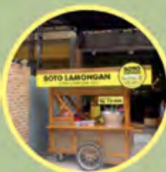
Gerobak Soto Lamongan Cak Bukin