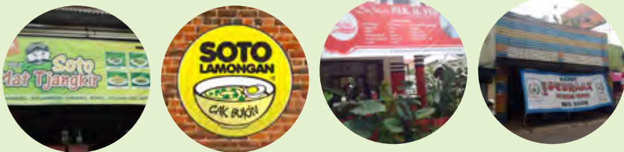
Beberapa Contoh Branding