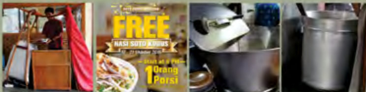
Pelayanan Warung Soto

Teknologi yang digunakan dalam dapat berupa peralatan dalam proses pengolahan soto, seperti menggurakan kuah, dan ada pula yang menggunakan panci atau 'dandang'. Teknologi juga bisa berupa alat untuk mempromosikan usaha. Misalnya penggunaan brosur, atau pemesanan soto melalui telepon, aplikasi maupun perangkat sosial media lainnya.