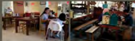
Desain Warung Soto Modern (Soto Kalus Semarang)

Tempat penjualan harus memberikan kenyamanan ataupun sensasi lain bagi pengunjung. Contoh warung soto di tengah sawah, warung soto dengan gubuk bambu, warung soto dengan konsep modern, warung soto dengan konsep kafe, warung tradisional.