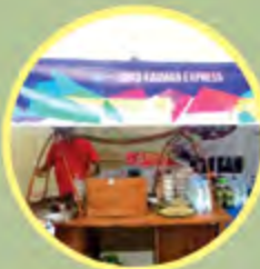
Pikulan Kuliner Soto Kauman Express